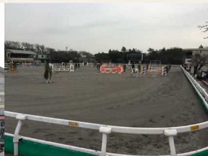
Il "Baji Park", sede delle gare di equitazione.