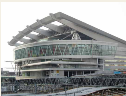
La "Saitama Super Arena" che ospiterà le gare di pallacanestro

Nell'ambito del processo di revisione del piano relativo ai siti di gara delle Olimpiadi di Tokyo, di recente è stato concordato con le associazioni sportive il cambiamento di tre location. 1. Pallacanestro: sarà sospesa la costruzione ex-novo della "Yume Plaza Arena B Yume-no-shima" e sarà utilizzata la "Saitama Super Arena"; 2. Equitazione: le gare saranno spostate dallo "Yume-no-shima Stadium" al "Baji Park"; 3. Canoa - Slalom: le gare saranno spostate dal "Kasai-Rinkai Slalom Course" a un'area contigua. Inoltre, anche per quanto riguarda il ciclismo, è stata annullata la costruzione di un nuovo impianto nella zona di Ariake ed è attualmente al vaglio l'utilizzo dell'impianto "Izu Velodrome" (già esistente).