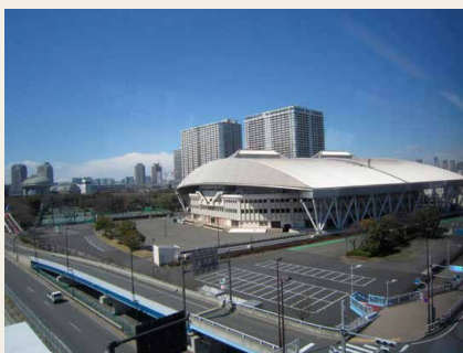
L'"Ariake Coliseum", preso in considerazione come sito per il Taekwondo

Stiprendo piede la decisione di non utilizzare il "Tokyo Big Sight" per le gare di lotta, scherma e taekwondo, come programmato inizialmente, e viene promossa la scelta di una sede alternativa. Alcuni media stranieri hanno fatto notare che lo spazio di questo sito è piuttosto limitato e il CIO ha deciso di tenere in considerazione questa osservazione. Al momento viene valutato il trasferimento delle gare di taekwondo all'"Ariake Coliseum", mentre come sito per le gare di lotta è stato preso in considerazione il "Nippon Budokan" (entrambe le strutture sono già esistenti).