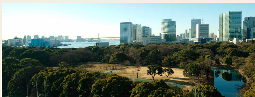
La villa "Hama-Rikyu"

Yoichi Masuzoe, il Governatore di Tokyo, è un forte sostenitore dell'idea di creare una residenza ufficiale per i VIP stranieri di proprietà della città di Tokyo, entro l'inizio delle Olimpiadi. Ha affermato, infatti, che "è importante che Tokyo, in quanto città che ospita i Giochi Olimpici, offra "ospitalità" in una residenza di proprietà della municipalità". Il piano è quello di ripristinare una residenza risalente all'era Meiji che si trova all'interno della tenuta della Hama-Rikyu, una villa circondata da uno splendido giardino in stile giapponese di fronte alla Baia di Tokyo. Nel bilancio preventivo per l'anno finanziario 2015 è stata inclusa una cifra pari a 100.000.000 yen per effettuare un'indagine sui costi di costruzione.