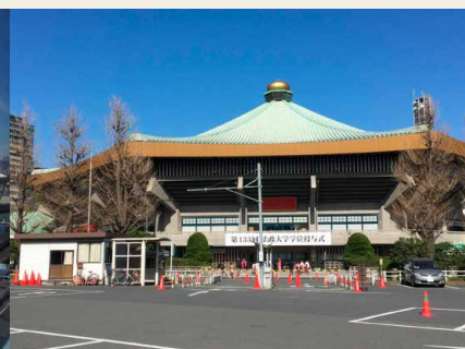
Il "Nippon Budokan" possibile sede delle gare di lotta