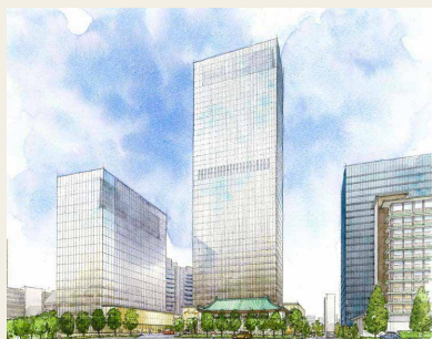
Rendering dell'hotel una volta completato

Procede il piano di smantellamento e ricostruzione dell'edificio principale dell'Hotel Okura di Tokyo, uno degli alberghi di lusso più rappresentativi del Giappone. Oltre ad offrire nuove camere, in previsione di un aumento della loro domanda collegato ai Giochi Olimpici di Tokyo del 2020, si prevede che l'edificio ospiterà al suo interno anche uffici, musei etc. Con molta probabilità le operazioni di progettazione e costruzione saranno affidate ad un consorzio di aziende che ruota intorno a Kajima Corporation e Taisei Corporation, che sono anche due dei principali azionisti dell'Hotel Okura.