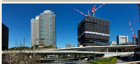
"The Prince Gallery, Tokyo Kioicho"

L'hotel di categoria più elevata del gruppo Prince Hotels, affiliato a Seibu Holdings Inc., sarà inaugurato nell'estate del 2016.