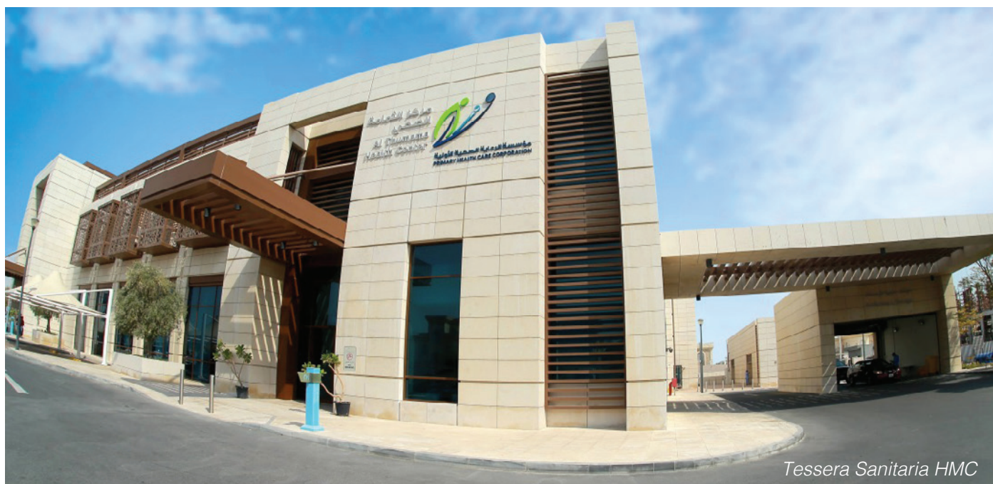
Tessera Sanitaria HMC

La Primary Health Care Corporation opera attraverso una rete di centri che forniscono un' assistenza primaria alla popolazione e sono diffusi in tutto il territorio del Qatar. Essi costituiscono il primo punto di riferimento per i pazienti che non presentano gravi sintomatologie e oltre a fare prevenzione, diagnosi e cura, offrono diversi tipi di trattamenti tra cui quello dentale, prenatale, immunologia, audiologia, radiologia e oftalmologia e wellness. Questi 27 centri sono diventati una delle piu' grandi reti di laboratori accreditati dal (CAP) College of American Pathologists. E' importante sottolineare che gli Health Centre hanno svolto un ruolo fondamentale di prevenzione, diagnosi, cura e vaccinazione durante la pandemia Covid 19.