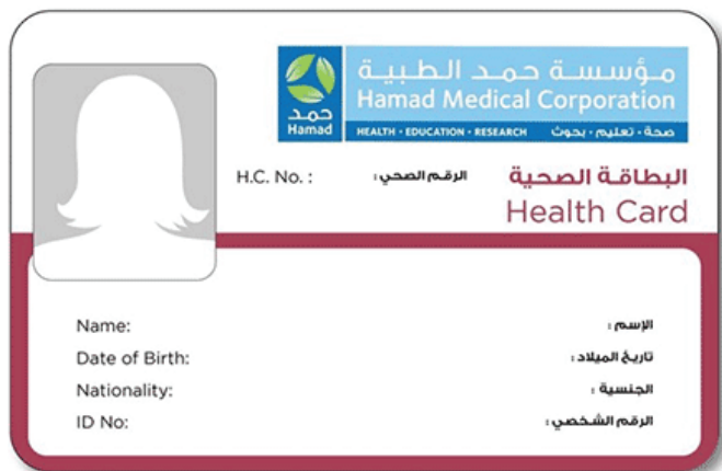
Tessera Sanitaria HMC

Tutti i Qatarini ed i residenti in possesso di documento d'identità e un permesso di soggiorno validi, possono per il momento accedere all'assistenza sanitaria pubblica in Qatar previo l'ottenimento della tessera sanitaria che puo' essere richiesta online oppure direttamente presso l'health centre di competenza territoriale.