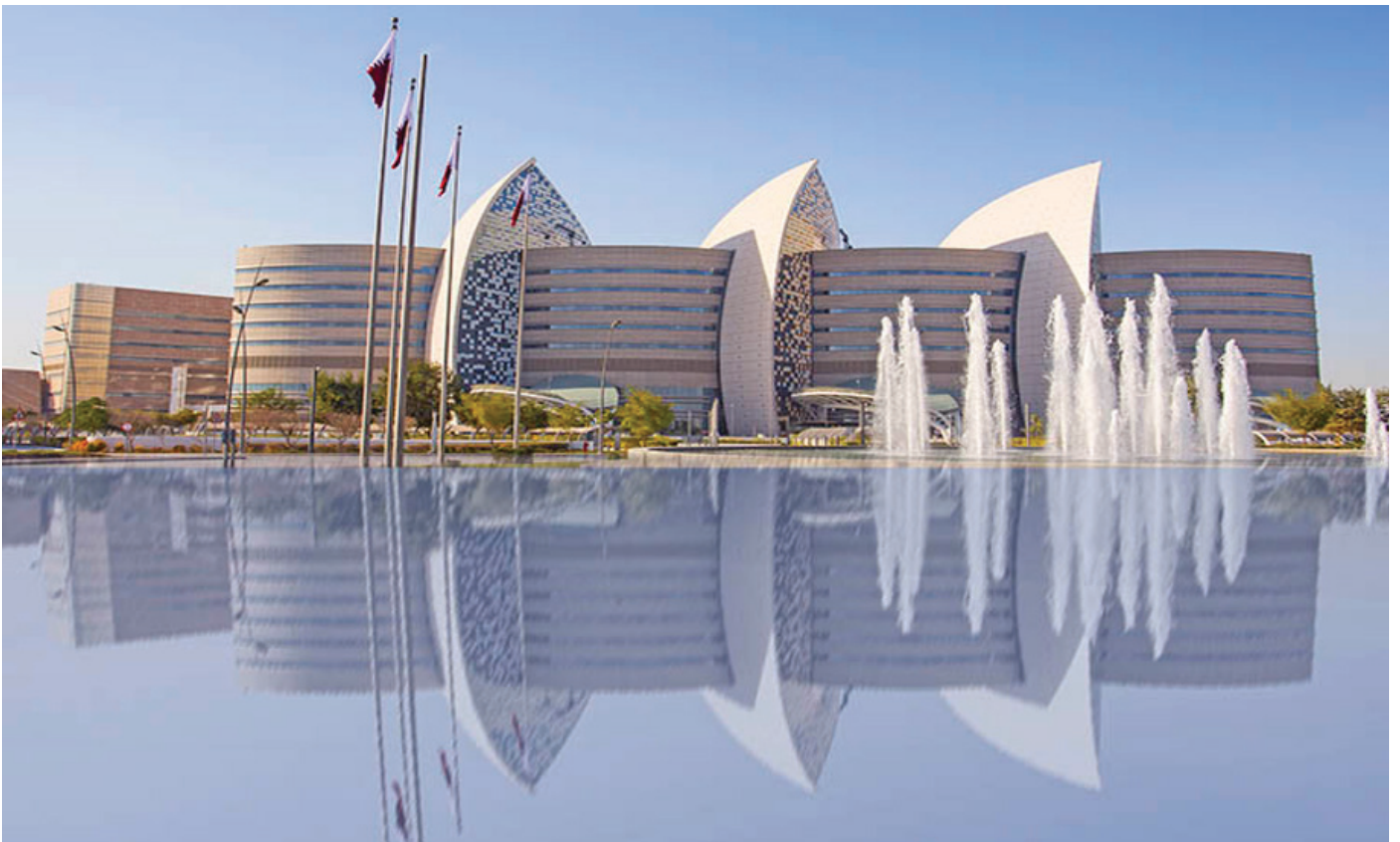
Tessera Sanitaria HMC

Un caso a parte è il Sidra Medical Centre, centro modernissimo e all'avanguardia per quanto riguarda l'assistenza sanitaria per donne bambini e ragazzi. Il Sidra Hospital e' una struttura medica e ospedaliera privata di pubblica utilità e parte di Qatar Foundation. Fondato dalla Qatar Foundation for Education, Science and Community Development, Sidra Medical Centre promuove l'educazione medica, la ricerca ed in particolare quella focalizzata sulle applicazioni pratiche della biomedicina.