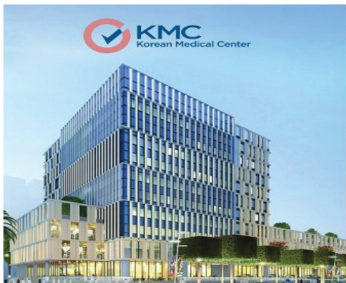
Korean Medical Center

Le strutture private includono ospedali e cliniche. Mentre gli ospedali privati in genere forniscono servizi e cure simili a quelli erogati dalle strutture pubbliche, le cliniche in genere tendono a specializzarsi in determinati settori: dentale, chirurgia estetica, dermatologia, otorinolaringoiatria, giusto per elencarne alcuni. I principali ospedali privati sono: Al Ahli Hospital, Doha Clinic, Al Emadi Hospital, American Hospital, Turkish Hospital, Korean Medical Center e a breve verterà inaugurato the View Hospital.