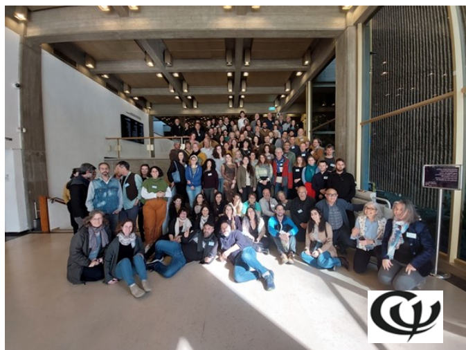
Foto di gruppo, Museo d'arte di Tel Aviv, 12 febbraio 2023

Il 12 febbraio si è svolta la conferenza annuale dell'organizzazione israeliana per la conservazione dei beni culturali (ONG). L'organizzazione è stata fondata nel 2007 da una comunità di conservatori in Israele il cui obiettivo è promuovere la professione della conservazione attraverso un organismo indipendente e autonomo. Oggi sono circa cento i conservatori, che rappresentano la maggior parte dei conservatori di musei e oggetti in Israele, alcuni dei quali lavorano per i dipartimenti di conservazione dei musei e gli altri sono restauratori indipendenti. Il tema dell'impegnativa conferenza è stato esperienze, errori e sorprese nei processi di conservazione ed ha visto l'apertura del saluto del Presidente dello Stato di Israele, Yitzhak Herzog.