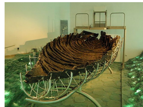
La barca in Ginosar

La barca presso il Kibbutz Ginosar , nota come barca di Gesù, è un'imbarcazione di legno scoperta per caso nel 1986 che risale al periodo compreso tra il 50 a.C. e il 70 d.C. lunga 8,20 metri, larga 2,30 metri e alta 1,25 metri, è esposta al museo Beit Yigal Alon di Ginosar, che si trova in una zona sismica attiva sulla faglia Siro-Africana. In questi giorni, e soprattutto alla luce dei terremoti regionali, c'è l'intenzione di prepararsi e proteggerla da possibili danni. Le dimensioni dell'imbarcazione e la sua estrema fragilità rappresentano una sfida per trovare una soluzione per un supporto antisismico e invitiamo le aziende italiane a presentare proposte che possano essere applicate.