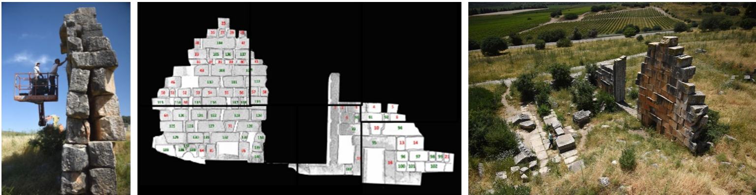
La facciata del tempio di Tel Kadesh che guarda verso est, la mappa che segna le pietre dell'edificio con i chip, l'esecuzione dell'inserimento dei chip nel 2022