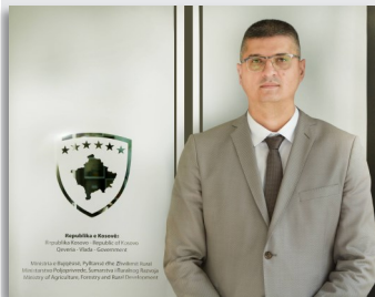
Nenad Rikallo Ministro dell'Agricoltura

Il Ministro kosovaro dell'Agricoltura, delle Foreste e dello Sviluppo Rurale, Nenad Rikallo e il direttore delle missioni dell'agenzia statunitense per lo